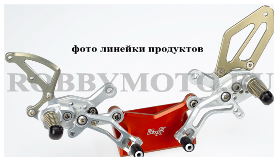
прочные профессиональные подножки SUPERBIKE