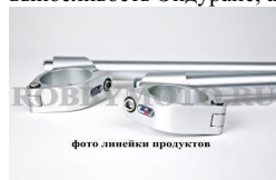
фото линейки продуктов

005-END515-A - специализированные клипоны RobbyMotoEngineering для гонок на выносливость Эндуранс, алюминий 6082, наклон 5 градусов, вес 670гр, съем хомута без съема траверсы.