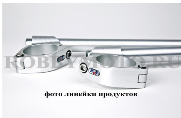
фото линейки продуктов

005-END515-A - специализированные клипоны RobbyMotoEngineering для гонок на выносливость Эндуранс, алюминий 6082, наклон 5 градусов, вес 670гр, съем хомута без съема траверсы.