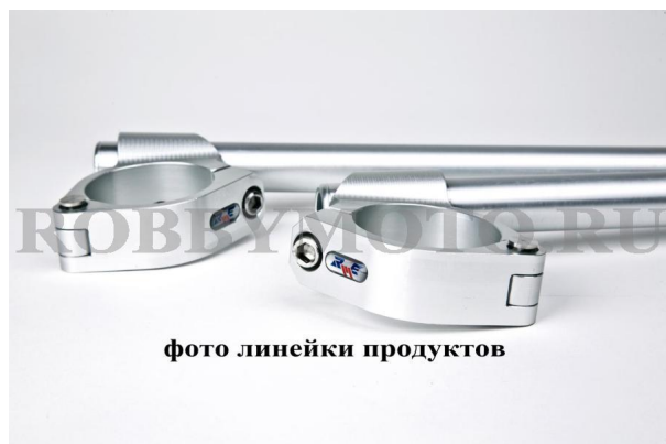
фото линейки продуктов

005-END515-N - специализированные клипоны RobbyMotoEngineering для гонок на выносливость Эндуранс, алюминий 6082, наклон 5 градусов, вес 670гр, съем хомута без съема траверсы.