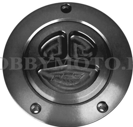
ФОТО ЛИНЕЙКИ ПРОДУКЦИИ