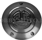
ФОТО ЛИНЕЙКИ ПРОДУКЦИИ

008-D001-N - выточенная из алюминия горловина топливного бака, алюминий 6082, 168гр., в комплекте с резиновой кольцевой прокладкой крышки