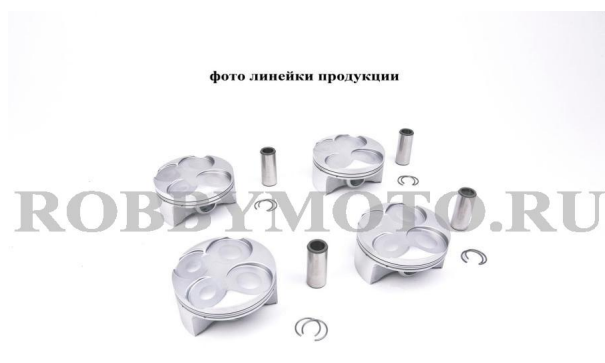
015-S003 - выполненные из алюминия 2618 легкие гоночные поршни