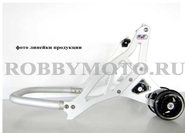
022-002-B - выточенный из алюминия 7075 сверх-легкий и стильный подкат под