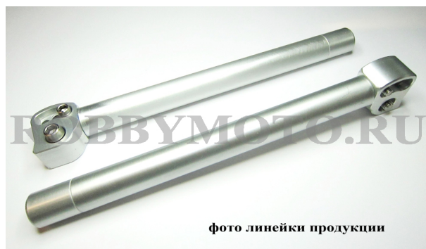
фото линейки продукции

Н-03-22-А - сменные рычаги для регулируемой серий клипонов