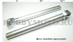
фото линейки продукции

RobbyMotoEngineering, алюминий 6000, толщина стенок 4 мм., вес пары 448 гр.